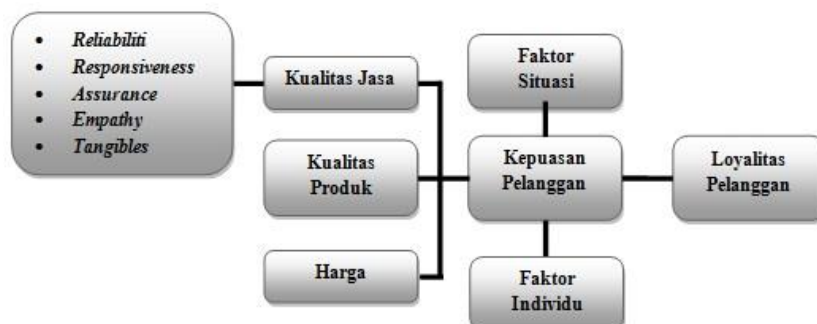
Gambar :1 Customer Perceptions of Quality and Customer Satisfaction

Selanjutnya dikemukakan juga oleh Zeithaml, Britner & Gremler (2009:103) bahwa kualitas layanan merupakan fokus yang mencerminkan persepsi pelanggan terhadap reliability (kehandalan), assurance (jaminan), responsiveness (ketanggapan), emphaty (empati), dan tangibles (berwujud). Namun disisi lain kepuasan pelanggan juga tercipta oleh kualitas produk, harga. Untuk membentuk suatu loyalitas pelanggan maka faktor situasional dan faktor personal perlu diperhatikan dalam mempengaruhi kepuasan yang dapat menciptakan loyalitas. Gambar 1 menunjukkan persepsi pelanggan terhadap kualitas sehingga terciptanya kepuasan pelanggan dan berujung pada loyalitas.