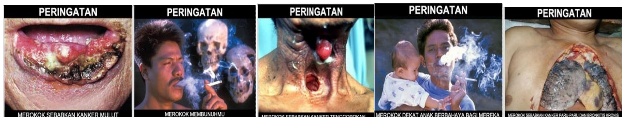
Bentuk gambar seram pada kemasan rokok setelah penerapan PP No 109 Tahun 2012