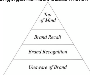
Gambar 3. Piramida Brand Awareness

Berdasarkan definisi di atas dapat disimpulkan bahwa kesadaran merek merupakan kemampuan konsumen untuk mengenali atau mengingat kembali suatu merek dari suatu kategori produk tertentu.