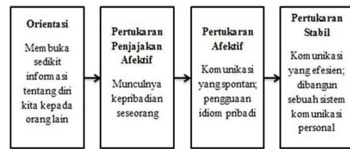
Gambar 2.1 Tahapan Proses Penetrasi Sosial