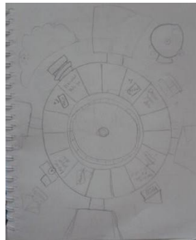
Gambar 3.1 Sketsa Papan Permainan

Papan permainan berfungsi sebagai media utama permainan yang digunakan untuk melangkah dan mengambil kartu makanan dan koin perawatan. Ilustrasi pada permainan ini berlatar di taman bermain dimana tempat tersebut terdiri dari permainan dan makanan- makanan yang dijual di taman bermain tersebut.