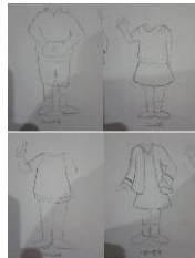
Gambar 3.3 Sketsa Pion

Pion karakter terdiri dari 4 pion, yaitu 2 anak laki-laki dan 2 anak perempuan. Pion ini berfungsi sebagai penanda dimana pemain berhenti dan melakukan aksi.