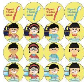
Gambar 3.8 Koin Perawatan Harian