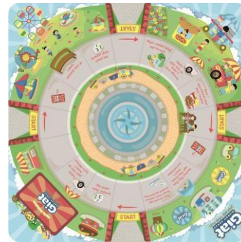
Gambar 3.2 Hasil jadi Papan Permainan