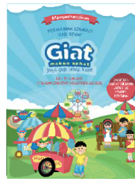
Poster dan Flyer