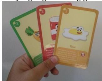
Gambar 3.7 Kartu Makanan

Permainan ini memiliki kartu makanan yang berisi makanan-makanan yang dapat menyebabkan karies gigi, makanan yang bagus untuk gigi.