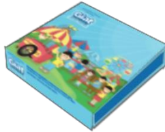
Gambar 3.11 Packaging

Kemasan berfungsi sebagai tempat menyimpan mainan ketika tidak dimainkan.