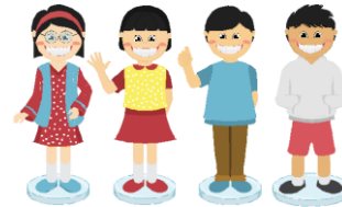
Gambar 3.4 Pion Karakter