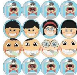
Gambar 3.9 Koin Perawatan Rutin Dokter