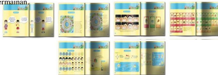
Gambar 3.10 Buku Panduan

an khalayak sasaran dan orang tua sebelum