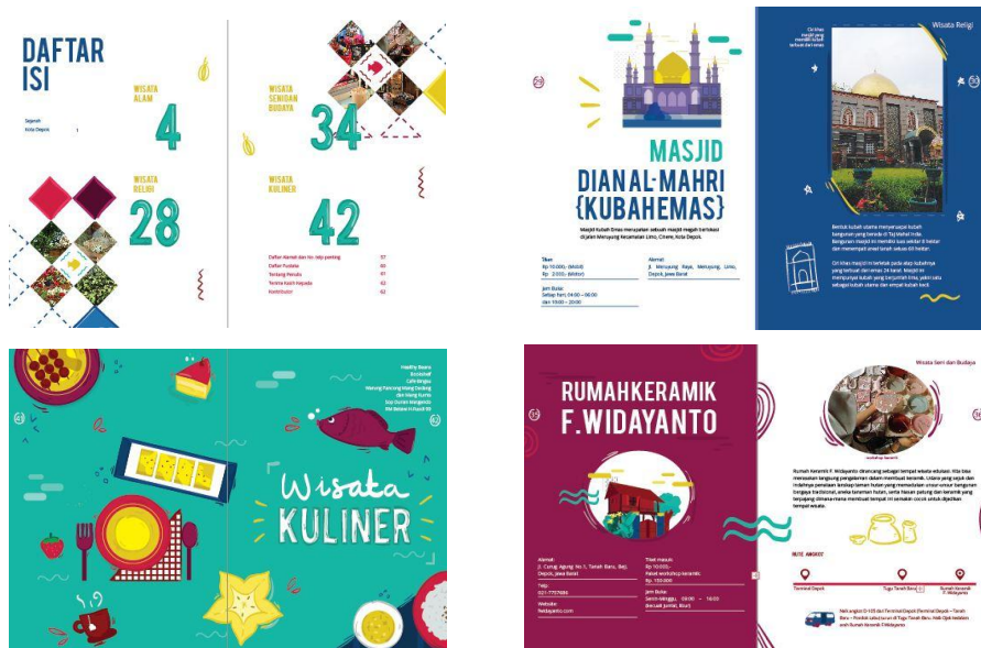
Gambar 2. Sample Layout Buku Panduan Wisata “Jelajah Depok”