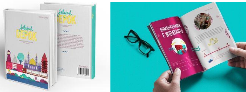
Gambar 1. Mock Up Buku Panduan Wisata “Jelajah Depok”