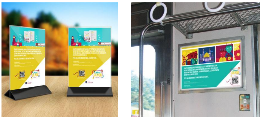
Gambar 6. Table Tent dan Wall Panel Commuter Line