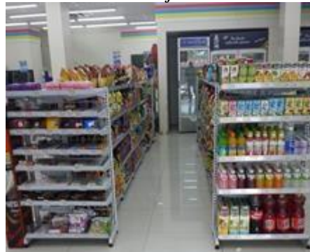
Gambar Kondisi Rak-rak & Lorong

Berdasarkan uraian diatas akhirnya Penulis tertarik untuk melakukan penelitian dengan mengambil judul : “Pengaruh Display Interior Terhadap Impulsive Buying pada Konsumen Indomaret Dipatiukur Bandung” .