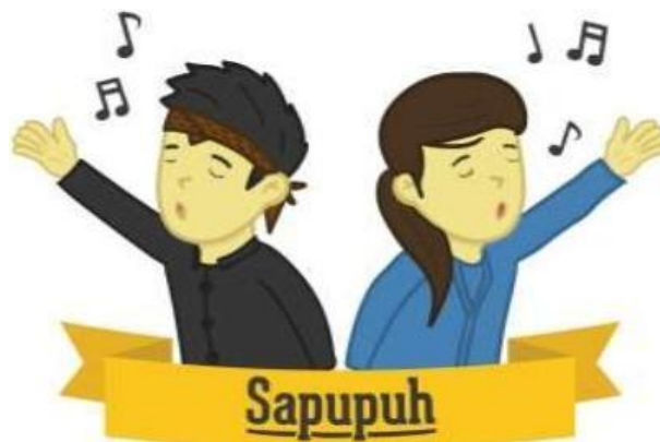
Gambar 1. Logo Sapupuh

Aplikasi yang dirancang memerlukan logo sebagai identitas dari aplikasi tersebut. Berikut adalah logo dari aplikasi “sapupuh” :