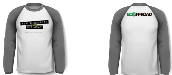
Gambar 4.18 T-shirt