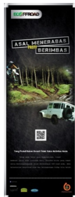
Gambar 4.13 Xbanner