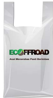
Gambar 4.16 Kantong plastik