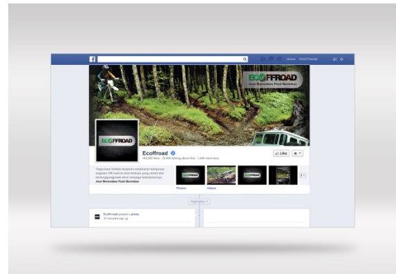
Gambar 4.17 Fanpage Facebook