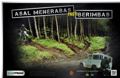
Gambar 4.14 Majalah Kampanye