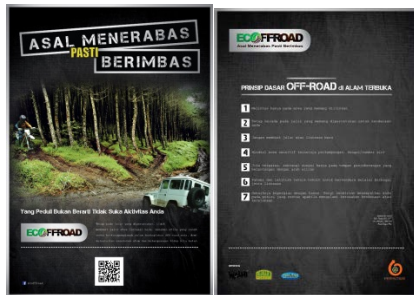
Gambar 4.12 Flyer Kampanye