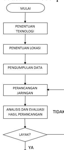
Gambar 1 Diagram Alir Perancangan

Pada bagian ini memaparkan langkah - langkah perancangan dari jaringan FTTH, sebagai panduan dalam proses penelitian agar sesuai dengan rencana. Berikut adalah model proses perancangan yang akan dilakukan: