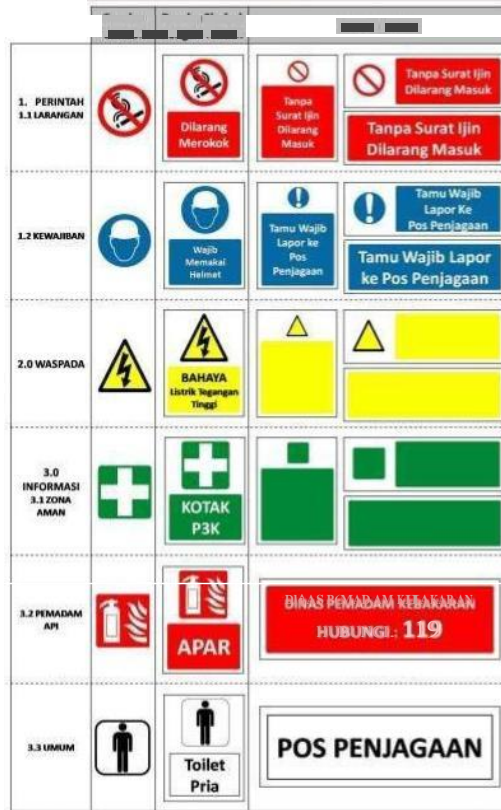
Gambar 2 Contoh Pemasangan Rambu Peringatan

Pada prosedur ini juga dikembangkan sebuah perancangan pemasangan rambu peringatan keselamatan yang dapat dilihat pada gambar 2.