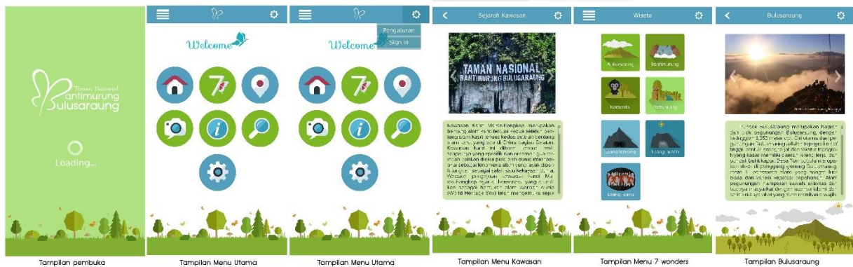
Gambar 4. User Interface