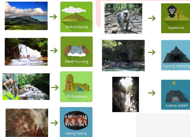
Gambar 3. 7 icon wisata