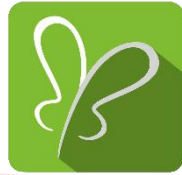
Gambar 2. Icon Apps