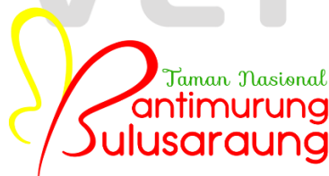
Gambar 1. Logo