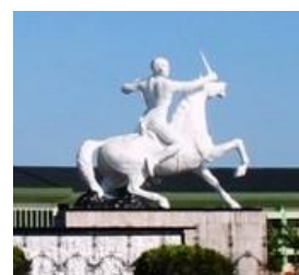
Gambar 4. Patung Diponegoro

Ilustrasi yang digunakan adalah semangat Pangeran Diponegoro. Pangeran Diponegoro adalah seorang pahlawan nasional dari Jawa Tengah yang perjuangannya sarat dengan nilai-nilai luhur dan semangat melekat dalam jiwa,