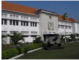
Gambar 1. Museum Mandala Bhakti

Museum Mandala Bhakti merupakan museum khusus tentang sejarah. Koleksinya berkaitan dengan benda-benda bersejarah khususnya tentang heroisme dan semangat patriotisme perjuangan prajurit Diponegoro. Perjuangan prajurit Diponegoro sejak kelahirannya pada awal revolusi fisik dahulu, dimana prajurit Diponegoro bersama-sama dengan rakyat berjuang merebut dan mempertahankan kemerdekaan nasional, sampai pada masa-pembangunan saat ini.