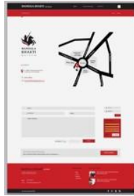
Gambar 16. Website Museum Mandala Bhakti