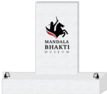
Gambar 9. Papan Nama Museum Mandala Bhakti