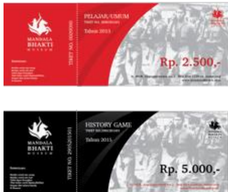
Gambar 10. Tiket Museum Mandala Bhakti