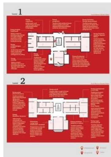
Gambar 12. Pedoman Museum Mandala Bhakti