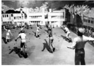
Gambar 5. perang agrasi militer

Pada media informasi akan menggunakan teknik Foto Digital dalam memunculkan image yang diinginkan. Hal tersebut dikarenakan foto mampu memberikan kualitas gambar yang sebenarnya dan akan lebih baik jika digabungkan dengan beberapa ilustrasi militer.