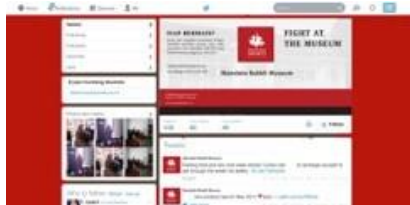
Gambar 17. Facebook dan Twitter Museum Mandala Bhakti