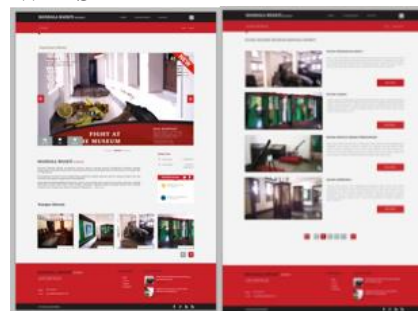
Gambar 16. Website Museum Mandala Bhakti