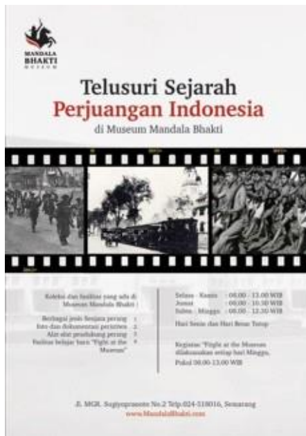
Gambar 14. Flyer Museum Mandala Bhakti