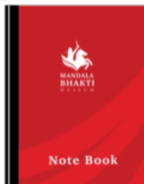
Gambar 18. Notebook Museum Mandala Bhakti