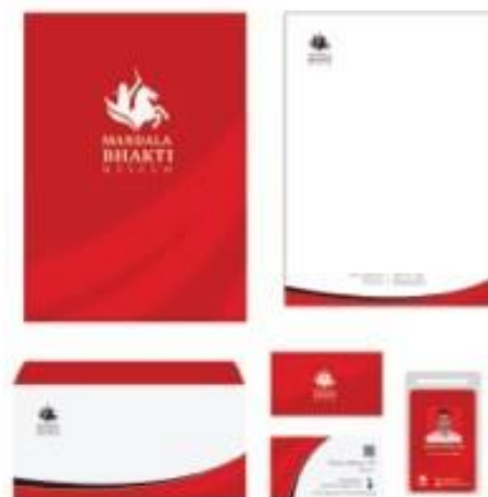
Gambar 8. stasionery

Konsep logo Museum Mandala Bhakti yang tegas dan dinamis diwujudkan dalam elemen desain dan warna-warna yang digunakan. Berikut adalah implementasi pada stasionery :