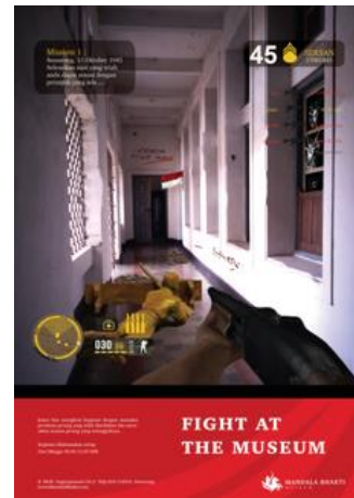
Poster History Game