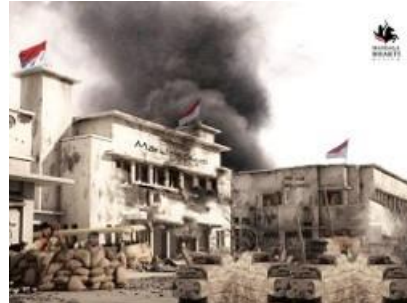
Gambar 21. Photo Booth Museum Mandala Bhakti