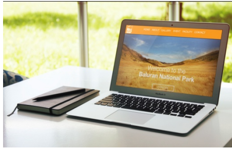
Gambar 3. Website Baluran National Park