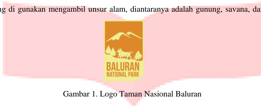
Gambar 1. Logo Taman Nasional Baluran

Logo yang di gunakan mengambil unsur alam, diantaranya adalah gunung, savana, dan hewan banteng jawa.