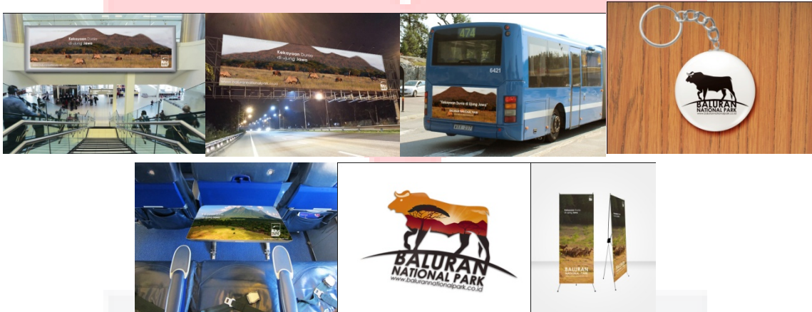
Gambar 4. Media Pendukung