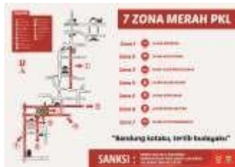
Gambar 2. Lokasi tujuh zona merah

Pedagang Kaki Lima merupakan suatu usaha kecil sektor informal yang keberadaannya dapat menyerap tenaga kerja terutama tenaga kerja dengan pendidikan rendah. Pedagang Kaki Lima mampu menyediakan dan menjajakan barang-barang nya dengan murah dan terjangkau.