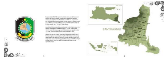
Gambar 5.3 Halaman Pembuka