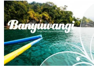
Gambar 5.1 Cover Depan