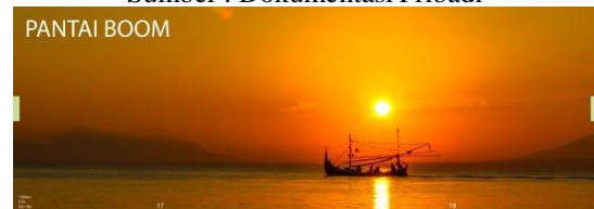
Gambar 5.4 Halaman Pembuka Setiap Objek Wisata