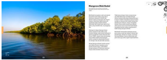
Gambar 5.5 Halaman Awal Setiap Objek Wisata