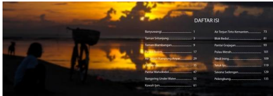
Gambar 5.6 Daftar Isi