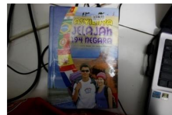
Gambar 3.8 Cover Asyiknya Jelajah 194 Negara

Buku ini dibuat pada tahun 2007 oleh PT. Fery Agung Corindotama. Buku ini berisi tentang objek-objek wisata yang terdapat di Indonesia. Menggunakan cover yang terlihat etnik dan nisi yang sangat lengkap membahas keunikan wisata tiap daerah, tetapi terkonsentrasi pada provinsi sehingga tidak terlalu detail dalam pembahasan seluruh objek wisata. Penataan layoutnya sangat rapi dan terkesan eksklusif.