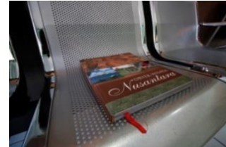
Gambar 4.2 Cover Objek Wisata Nusantara