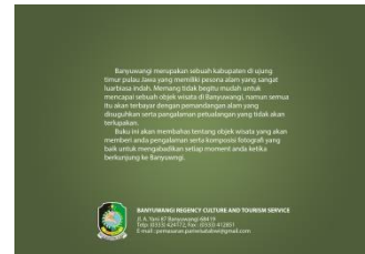
Gambar 5.2 Cover Belakang