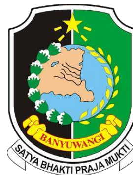
Gambar 3.1 Logo Dinas Kebudayaan dan Pariwisata Kabupaten Banyuwangi

Dinas Pariwisata dan Kebudayaan berdasarkan peraturan Bupati Kabupaten Banyuwangi Nomor