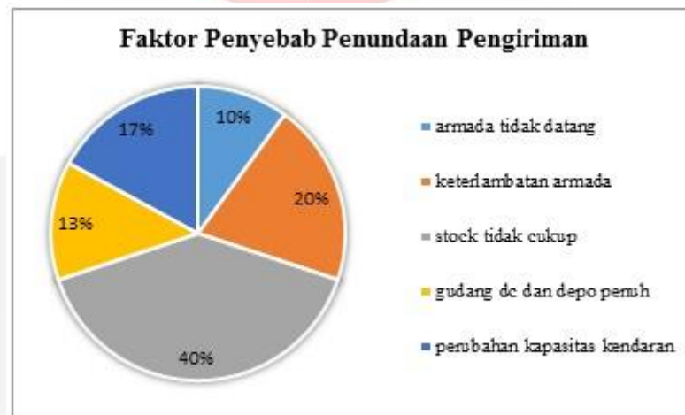
Gambar I.1 Faktor Penyebab Penundaan Pengiriman

Berdasarkan data jumlah permintaan dan pengiriman aktual pada tahun 2014, diperoleh rata-rata pengiriman sebesar 79% dan jumlah tersebut masih berada dibawah target perusahaan yang menetapkan minimal pengiriman yang seharusnya sebesar 95% dari jumlah permintaan konsumen. Adanya permintaan yang tidak terpenuhi disebabkan oleh beberapa faktor yang terjadi di perusahaan.