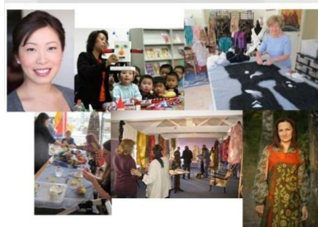
Gambar 3. Lifestyle Board