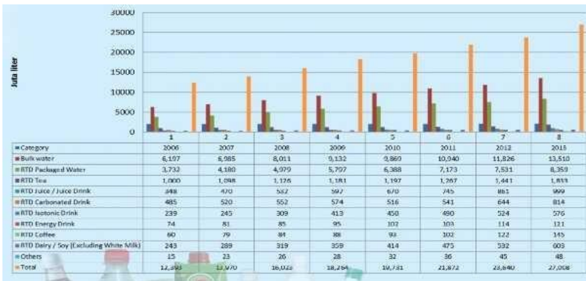
Gambar 1.1 Pertumbuhan Minuman Ringan Siap Saji

minuman praktis membuat industri minuman berlomba-lomba untuk membuat produk minuman ringan siap saji untuk memenuhi kebutuhan konsumen. Sehingga membuat produsen diharuskan lebih kreatif dalam membuat inovasi suatu produk minuman ringan agar memiliki daya saing dari produk yang lain. Pertumbuhan industri minuman ringan siap saji juga membuat semakin banyaknya perusahaan baru yang bermunculan dengan berbagai macam merek produk baru yang beredar di pasaran.