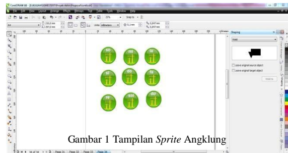
Gambar 1 Tampilan Sprite Angklung

Proses Desain UI antar muka dan asset objek berupa, gambar sprite Angklung, animasi sprite nadalbuKartini dan gambar tombol yang dibuat pada perangkat lunak Adobe CorelDraw dan Adobe Flash.