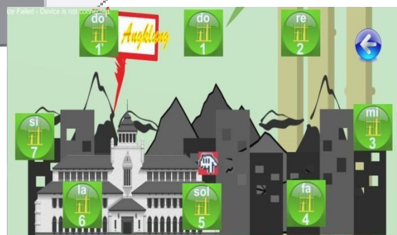
Gambar 6 Tampilan GamePlay Main Angklung

Pada fungsionalitas ini pengguna akan dihadapkan pada tampilan dari fitur Bermain angklung, dimana terdapat 3 menu dalam fitur ini yaitu Main Angklung, Demo Lagu dan Jenis Angklung. Dalam fitur ini pengguna dapat memilih 3 menu tersebut dan sistem akan mengeluarkan informasi mengenai cara menggunakan gameplay dari menu-nya masing-masing. Pada fitur ini juga terdapat button home dimana pengguna dapat kembali ke tampilan utama.