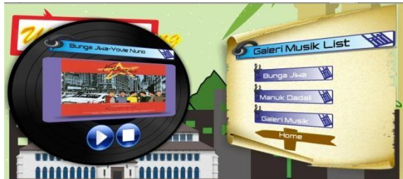
Gambar 7 Tampilan Galeri Musik

Pada fungsionalitas ini pengguna akan dihadapkan pada tampilan dari fitur Galeri Musik, dimana terdapat beberapa daftar list musik yang dapat dimainkan. Dalam fitur ini pengguna dapat memilih list musik yang tersedia dan pengguna akan ditampilkan dari menu list lagu yang dipilihnya. Pada fitur ini juga terdapat button home dimana pengguna dapat kembali ke tampilan utama.