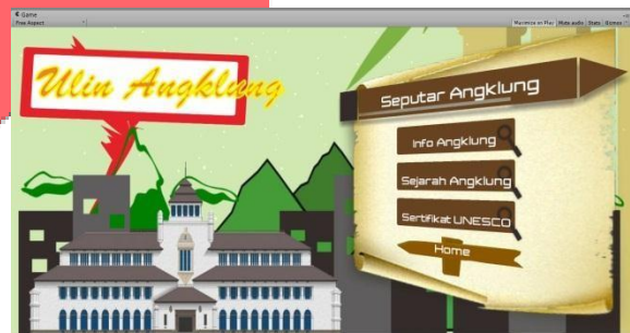
Gambar 5 Tampilan Seputar Angklung

Pada fungsionalitas ini pengguna akan dihadapkan pada tampilan dari fitur Seputar angklung, dimana terdapat 3 menu dalam fitur ini yaitu Info Angklung, Sejarah Angklung dan Sertifikat UNESCO. Dalam fitur ini pengguna dapat memilih 3 menu tersebut dan sistem akan mengeluarkan berbagai informasi sesuai dengan menu yang masing-masing. Pada fitur ini juga terdapat button home dimana pengguna dapat kembali ke tampilan utama.