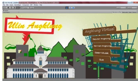
Gambar 4 Tampilan Utama Aplikasi

Pada fungsionalitas ini pengguna akan dihadapkan pada tampilan utama aplikasi, dimana terdapat 3 fitur utama pada aplikasi ini yaitu "Seputar Angklung", "Bermain Angklung" dan "Galeri Musik". Pengguna dapat memilih salah satu fitur tersebut dengan cara mengklik fitur yang dikehendaki.