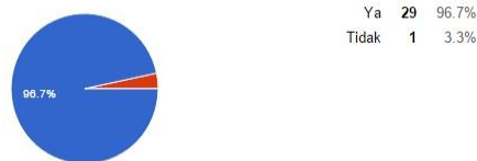
Gambar 8 Hasil survei 6

Apakah materi telah disajikan dengan baik?