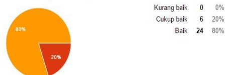
Gambar 12 Hasil survei 10

Apakah desain antarmuka aplikasi Melajah Basa Bali ini baik?