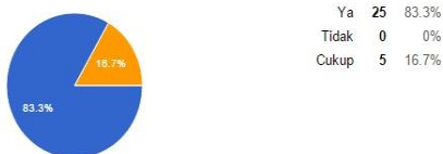
Gambar 11 Hasil survei 9

Apakah fitur kuis ini menarik dan efektif untuk pembelajaran Sor Singgih Bahasa Bali?