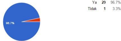
Gambar 6 Hasil survei 4

Apakah fitur materi pada aplikasi Melajah Basa Bali telah berfungsi dengan baik?