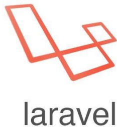
Gambar 1 - Logo Laravel

Laravel adalah salah satu web application framework yang bersifat open source. Framework ini berjalan diatas PHP 5 dan berbasis MVC (Model View Controller). Laravel pertama kali dirilis pada 22 Februari 2012, dan versi stabil terbaru adalah versi 4.2.11 yang dirilis pada 4 Oktober 2014 [8].