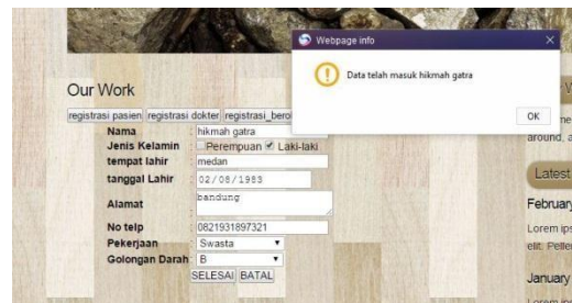
Gambar 4-1 penginputan data pasien

Penginputan ini dilakukan pada pasien yang belum pernah berobat di puskesmas sebelumnya. Tapi apabila pasien sudah terdaftar di puskesmas maka tidak perlu lagi melakukan penginputan ini. Pertama masukan dulu datanya kemudian klik selesai. Maka akan muncul pemberitahuan data masuk pada database.