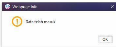
Gambar 4-4 pemberitahuan data masuk

Apabila sudah masukan data pada halaman web ini maka klik selesai sampai muncul pemberitahuan data masuk pada database atau tidak.