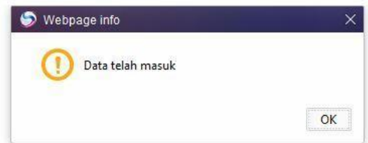
Gambar 4-7 pemberitahuan data masuk

Apabila sudah masukan data pada halaman web ini maka klik selesai sampai muncul pemberitahuan data masuk pada database atau tidak.