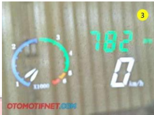
Gambar 1. Tampilan Head Up Display

Head up display adalah tampilan transparan yang menyajikan informasi tanpa mengharuskan penggunanya untuk melihat dari sudut pandang yang biasa. Head up Display (HUD) sudah digunakan pertama kali pada pesawat. HUD sudah digunakan dalam dunia otomotif sejak tahun 1988 oleh general motors. HUD dapat menampilkan informasi kendaraan pada kaca depan, langsung pada area pandang pengemudi dan tak perlu lagi menunduk atau mengalihkan pandangannya dari jalan di depannya. hal itu lah yang membuat HUD memiliki prospek menjanjikan.[2]