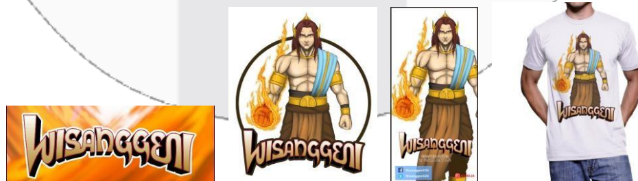
Gambar 5. Media Pendukung

Media pendukung yang bersifat promosional, menggunakan poster, x-banner, dan media sosial. Terutama pemanfaatan media sosial yang dekat dengan target remaja yang diharapkan bisa efektif untuk mengenalkan novel grafis ini. Untuk x-banner dan poster bisa digunakan pada event atau pameran karena secara visual menarik pengunjung untuk melihat media utama yaitu novel grafis. Media pendukung lainnya bersifat merchandise karena media tersebut bersifat dimiliki dan diberikan atau diperjual belikan kepada khalayak pada waktu tertentu.