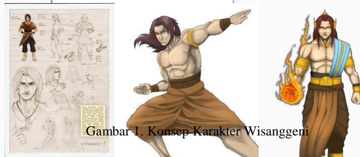
Gambar 1. Konsep Karakter Wisanggeni

Penggunaan elemen visual pembantu dalam adegan tertentu, seperti pertarungan dan gerakan (motion) diambil dari referensi novel grafis yang telah terbit dan komik pada kebanyakan. Suasana latar belakang berdasarkan dari penggambaran yang ada dalam cerita. Berdasarkan hasil observasi sendiri, penggambaran visual dalam komik dan novel grafis terutama yang telah terbit pada kebanyakan di pasaran memiliki ketertarikan sendiri terutama pada penggunaan sound effect dalam kata-kata yang lebih menarik pembaca jauh lebih dalam pada adegan tersebut.