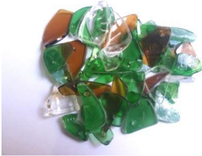
Gambar 7. Kaca Yang Telah Dilubangi

3. Melubangi Kaca Sebagai Akses Masuknya Material Penunjang seperti Tali