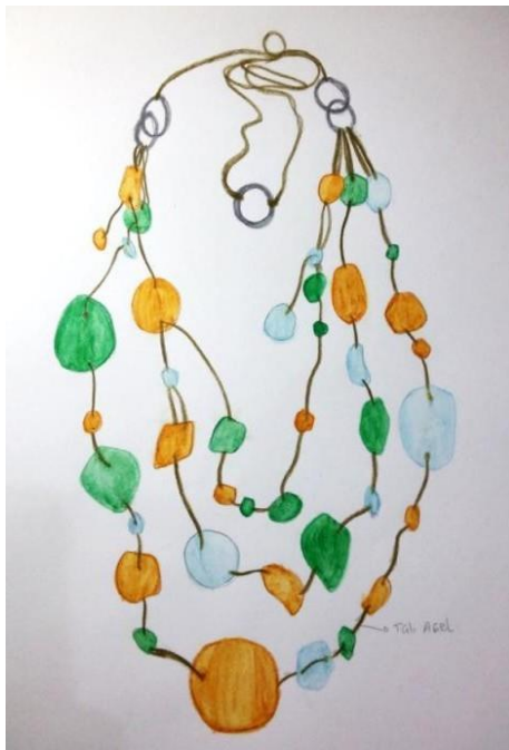
Gambar 4. Sketsa Desain Kalung Matinee

Ekplorasi yang dilakukan dalam penelitian ini adalah untuk menghasilkan bentuk dan tekstur baru, kemudian pecahan yang sudah diolah menjadi bentuk baru akan dilubangi terlebih dahulu dan kemudian pecahan kaca tersebut siap dipakai untuk proses pembuatan aksesoris, berikut tabel eksplorasi yang dilakukan: