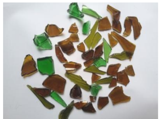
Gambar 6. Kaca Yang dihaluskan