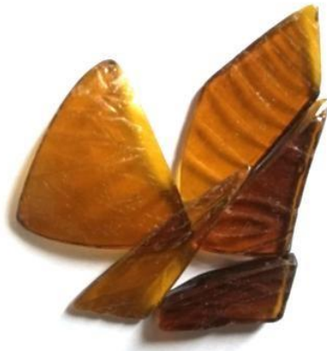
Gambar 8. Kaca yang Telah di Motif

4. Memberikan tekstur dan motif pada kaca dengan alat engrave pen