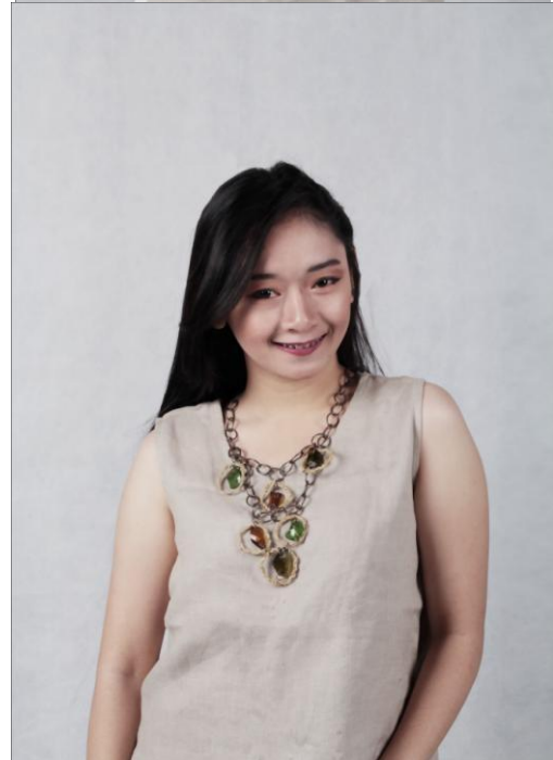
Gambar 12. Hasil Kalung