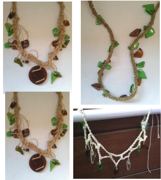
Gambar 11. Penggabungan Bandul

Bandul yang sudah siap akan digabungkan dengan menggunakan material lain berupa benang dan serat alam.