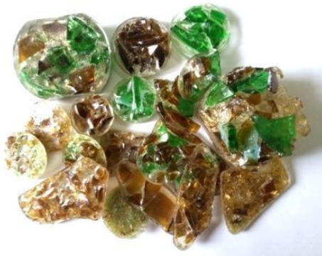
Gambar 9. Gabungan Kaca Menggunakan Resin

5. Eksplorasi menggabungkan pecahan kaca kecil menggunakan resin.