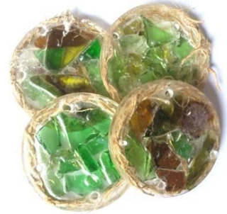
Gambar 10. Gabungan Kaca dengan Resin dan Akar

6. Gabungan Kaca dengan resin dan hiasan akar.