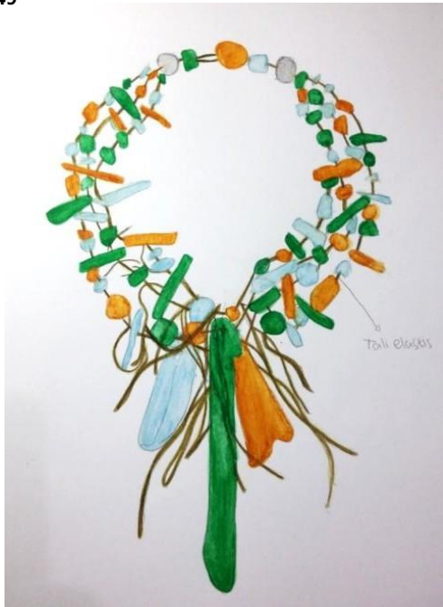
Gambar 3. Sketsa Desain Kalung Bib