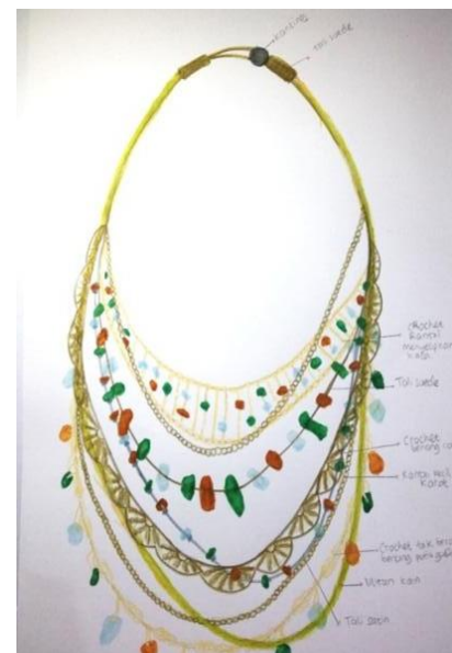
Gambar 2. Sketsa Desain Kalung Bib