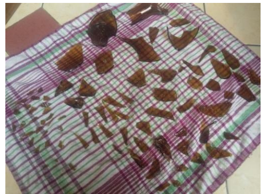
Gambar 5. Pecahan Kaca Botol