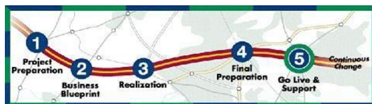
Gambar 2.1 Accelerated SAP Roadmap

Metode ASAP yang secara signifikan mempercepat proses deployment ERP dan langsung bisa berakhir sesuai dengan project plan . Metode ASAP membantu agar implementasi ERP memberikan hasil yang efektif, efisien dan optimal terutama dalam hal waktu, biaya, kualitas, kesesuaian dengan kebutuhan serta pemanfaatan sumber daya yang ada. Metode ASAP memiliki lima tahapan yang meliputi, Project Preparation , Business Blueprint , Realization , Final Preparation , Go Live & Support [11]. Tahapan ASAP dapat dilihat pada Gambar 2.1 berikut