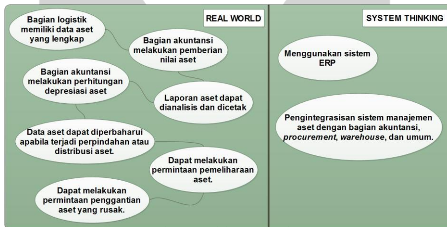
Gambar 3 Model Konseptual

Model konseptual menggambarkan aliran dan ketergantungan aktivitas-aktivitas yang sebelumnya telah dideskripsikan dalam root definition . Model konseptual dikembangkan dari C.A.T.W.O.E. Gambar 3 merupakan model konseptual dari penelitian.