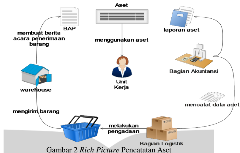
Gambar 2 Rich Picture Pencatatan Aset