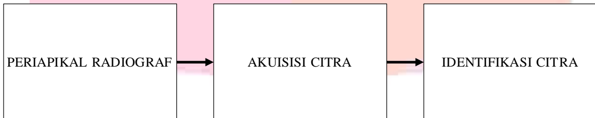
Gambar 2.1 Diagram Blok Model Sistem

Pada perancangan sistem ini akan dijelaskan tentang alur pembuatan program dan penjelasan secara rinci pada setiap tahapan. Pada penelitian ini, perancangan sistem deteksi penyakit pulpitis ini menggunakan metode segmentasi citra watershed dan klasifikasi dengan K-NN. Tahapan umum yang dilakukan pada perancangan sistem deteksi pulpitis ini adalah tahap identifikasi citra. Pada perancangan sistem digambarkan dalam diagram blok sebagai berikut :