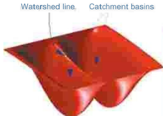
Gambar 2.2 Diagram Blok Model Sistem

Untuk sekumpulan pixel yang memiliki nilai intensitas minimum tertentu dan memenuhi kondisi (b) akan disebut sebagai lembah penampungan ( catchment basin ), sedangkan sekumpulan pixel yang memenuhi kondisi (c) disebut sebagai garis watershed. Jadi segmentasi dengan metode watershed mempunyai tujuan untuk melakukan pencarian garis watershed. [3][4]