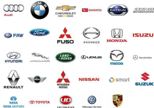
Gambar 1.1 Merek mobil yang mengikuti GIAS 2015

Gaikindo Indonesia International Auto Show 2015 menjadi wadah bagi para produsen mobil untuk memperkenalkan produk mereka ke konsumen, hal ini di manfaatkan oleh PT. Tata Motors Distribusi Indonesia (TMDI) yang secara resmi mengumumkan keikutsertaannya di ajang Gaikindo Indonesia International Auto Show (GIAS) 2015. Pada Gaikindo Indonesia International Auto Show 2015 PT. Tata Motors Distribusi Indonesia (TMDI) meluncurkan program baru dengan memberikan garansi selama 3 tahun bagi pembeli yang membeli produknya di GIAS 2015. Program ini diluncurkan oleh TMDI untuk menarik simpati pengunjung GIAS 2015 agar berani membeli dan merasakan keunggulan serta ketangguhan produk Tata Motors. Selain itu,