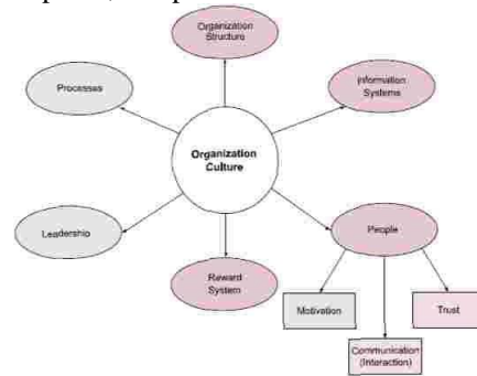
Gambar 1. Framework Budaya Organisasi Berdasarkan Hasil Penelitian Gupta & Govindarajan

Mengacu pada jurnal penelitian Al-Alawi et.al. (2007: 23) yang menyatakan bahwa ada enam dimensi utama budaya organisasi yang dikemukakan oleh Gupta & Govindarajan hasil dari penelitian mereka pada tahun 2000, enam kategori budaya organisasi tersebut adalah struktur organisasi, sistem informasi, sumber daya manusia, sistem penghargaan, kepemimpinan, dan proses.