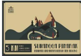
Gambar 10. Billboard

Billboard diperlukan untuk menunjukkan dan menandai lokasi Rumah Teh Ngoro Donker. Mengingat lokasi Rumah Teh Ngoro Donker berdekatan dengan objek wisata lain yaitu Candi Cetho dan Grojogan Sewu, tentunya keberadaan billboard dapat memberikan informasi serta menjadi penarik perhatian bagi masyarakat yang melewati jalan tersebut. Billboard akan diletakkan di dekat objek wisata I Candi Cetho dan Grojogan Sewu.