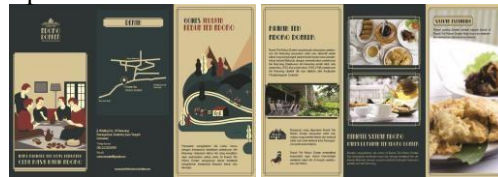
Gambar 7. Brosur

Brosur digunakan untuk menyampaikan informasi dengan lebih detail. Brosur akan dibagikan kepada target audience yang belum mengetahui Rumah Teh Ndoro Donker. Sehingga nantinya, brosur akan berfungsi sebagai pemberi informasi agar dapat menarik perhatian target audience . Brosur akan diletakkan di tempat-tempat yang sering dikunjungi wisatawan, seperti di sekitar Candi Cetho, Grojogan sewu dan pusat-pusat keramaian di kota Surakarta.