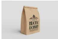
Gambar 11. Paper Bag

Paper Bag diberikan kepada pengunjung Rumah Teh Ngoro Donker yang membeli teh kemasan. Penggunaan paper bag bertujuan untuk memberikan ingatan kepada pengunjung akan Rumah Teh Ngoro Donker.