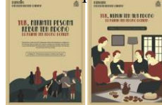
Gambar 8. Flyer

Flyer berisikan informasi yang lebih padat dibandingkan dengan brosur. Flyer berisi promo yang sedang diadakan. Sehingga flyer tersebut akan digunakan untuk membujuk target audience yang telah mengenal dan mengetahui Rumah Teh Ndoro Donker untuk melakukan kunjungan ulang. Mengingat pengunjung Rumah Teh Ndoro Donker saat ini masih didominasi masyarakat kota Surakarta, flyer dibagikan di pusat-pusat keramaian di kota Surakarta. Flyer ini dibagikan melalui stand/booth yang dibuat di beberapa mall di kota Surakarta seperti Hartono Mall, Solo Square dan Solo Grand Mall.