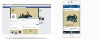
Gambar 15. Facebook dan Instagram

Facebook dan Instagram berperan dalam memberikan informasi terbaru tentang menu atau promo yang sedang diadakan. Melalui Facebook dan Instagram pengelola dapat berinteraksi langsung dengan target audience dan dapat secara langsung pula mendapatkan feedback . Penggunaan Facebook dan Instagram sebagai media promosi ditujukan untuk target audience yang berusia diatas 26 tahun yang cenderung masih menggunakan Facebook dan Instagram sebagai media informasinya.