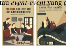
Gambar 6. Digital Poster

Digital poster akan ditampilkan kedalam media-media digital seperti website , Facebook dan Instagram. Digital poster ini berisikan promo atau event-event yang diadakan oleh Rumah Teh Ndoro Donker.