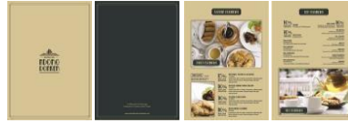
Gambar 5. Buku Menu

Buku menu diberikan kepada pengunjung Rumah Teh Ndoro Donker. Buku menu berisi menu makanan dan minuman yang ada di Rumah Teh Ndoro Donker yang disertai harga dan penjelasan dari masing-masing menu.