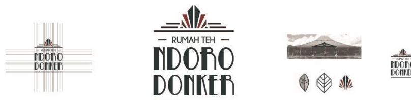
Gambar 3. Logo

Logo diatas merupakan hasil dari perancangan yang dilakukan oleh penulis. Logo terdiri dari logotype dan logogram . Pada Logogram membentuk sebuah bentuk baru yang menyerupai bangunan dasar keraton Mangkunegaran. Terdapat pula tiga garis dibagian atas yang merupakan simbolisasi bentuk atap keraton Mangkunegaran dan satu garis dibawah sebagai penyeimbang. Dilengkapi dengan bagian atas bangunan keraton Mangkunegaran yang dipadukan dengan bentuk daun teh yang telah di transformasi sesuai dengan bentuk-bentuk art deco . Pada logotype yang bertuliskan Rumah Teh Ngoro Donker menggunakan font Betty Noir sebagai headline yang mengutamakan kesan art deco yaitu simetris dan mewah serta menggunakan font Champaign & Limousin sebagai sub-headline denganketerbacaan yang jelas. Warna-warna solid yang digunakan pada logo menimbulkan kesan art deco dengan kemewahan dan kekuatannya sebagai sebuah brand.