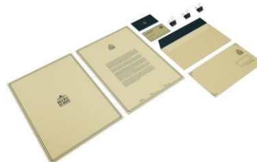
Gambar 4. Stationery

Stationery yang digunakan berupa kartu nama, amplop, kop surat, buku menu dan lain-lain yang dapat digunakan oleh pemilik untuk secara langsung dapat menginformasikan identitasnya. Stationery memudahkan pengunjung atau rekan bisnis untuk melakukan identifikasi pada Rumah Teh Ngoro Donker.