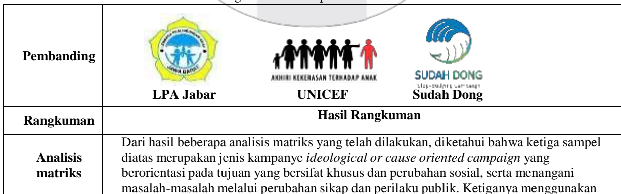
Tabel 3.7 Pengambilan kesimpulan berdasarkan analisis

Menurut teori kampanye dalam buku manajemen kampanye, perancangan kampanye ini merupakan jenis kampanye ideologically or cause oriented campaigns [8] yaitu jenis kampanye yang berorientasi pada tujuan yang bersifat khusus dan perubahan sosial. Ditujukan untuk menangani masalah-masalah sosial melalui perubahan sikap dan perilaku publik. Komik merupakan Bahasa yang divisualkan [9], dan Pop Art merupakan budaya kontemporer yang bereaksi terhadap fenomena yang terjadi dari pengalaman masyarakat [10]. Target sasaran dari kampanye ini adalah pelajar SMP atau remaja dengan rentang umur antara 12-15 tahun di kota Bandung, dengan target sekunder masyarakat kota Bandung. Adapun beberapa proyek sejenis memiliki ciri khasnya masing-masing. Berikut tabel hasil analisis dari pembandingan proyek sejenis :