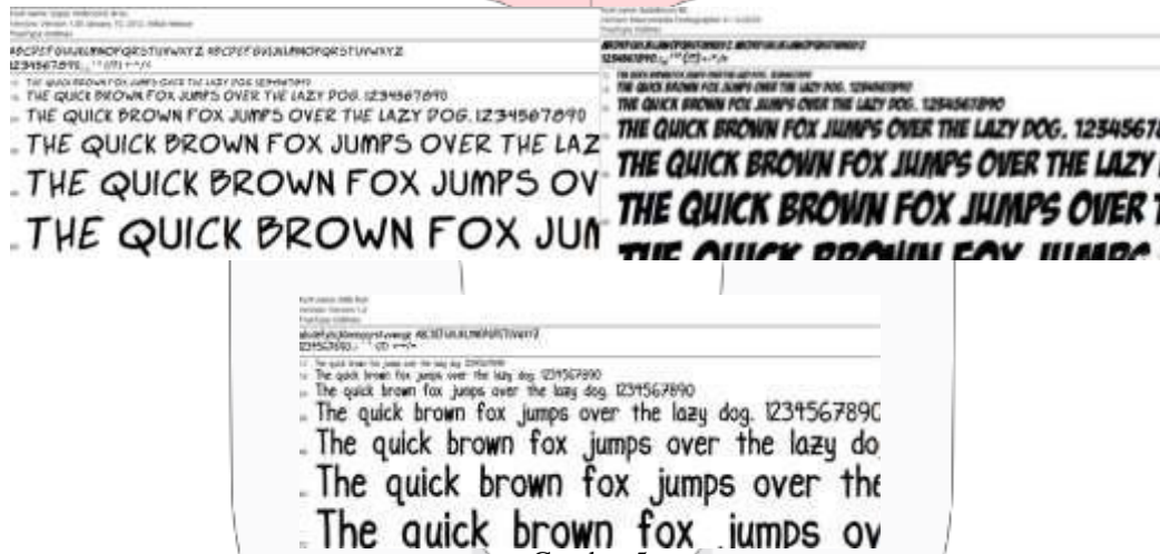
Gambar 5 Jenis font Superwebcomic bros, Badaboom BB, dan Milk Run

Karakter diatas adalah karakter (dari kiri ke kanan) Ayah, Kakak, Ibu, Agah, dan Barna. Kelima karakter ini menggambarkan sebuah keluarga dan teman akab dari Asep. Karakter ini akan menggambarkan orang terdekat bagi korban maupun saksi kekerasan yaitu Asep untuk mengatakan apa yang dilihat atau di alami. Karakter ini akan digunakan pada media poster sebagai salah satu orang terdekat dalam tahapan pencegahan kekerasan. Adapun jenis tipografi yang digunakan adalah jenis Sans Serif yaitu Superwebcomic bros, Badaboom BB, dan Milk Run.