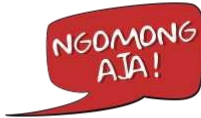
Gambar 1 Logo Kampanye Ngomong Aja

Pada visual media perancangan kampanye menggunakan gaya gambar pop art dan komik. Memiliki karakter yang bernama Asep yang berasal dari kota Bandung.