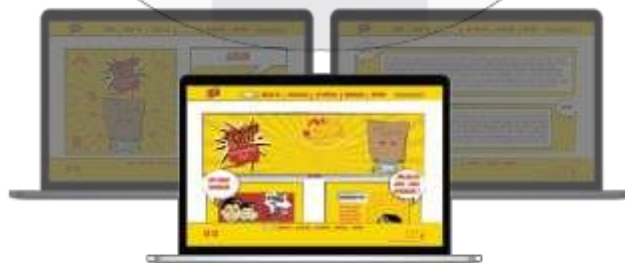
Gambar 6 Website Kampanye