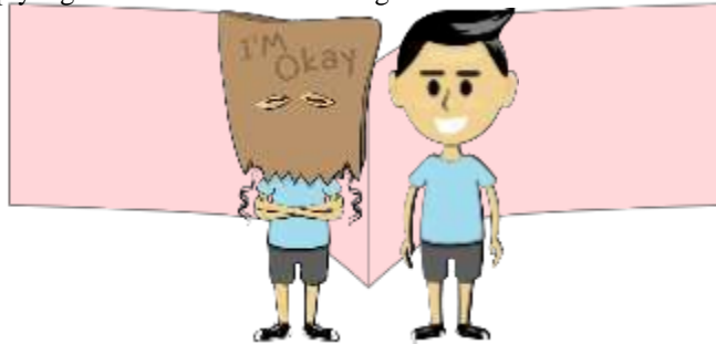
Gambar 2 Karakter Asep

Pada visual media perancangan kampanye menggunakan gaya gambar pop art dan komik. Memiliki karakter yang bernama Asep yang berasal dari kota Bandung.