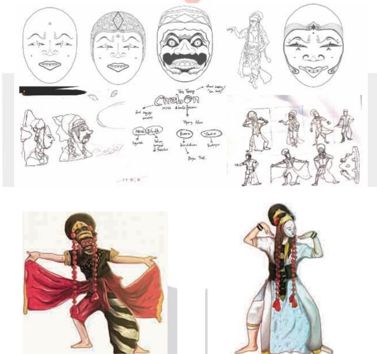
Gambar 2 dan Gambar 3 Hasil Sketsa dan Digital

Gaya ilustrasi yang peneliti gunakan dan buku visual Sejarah dan Filosofi Topeng Cirebon ini menggunakan gaya lead character serta pewarnaan yang pop. Garis yang digunakan juga menggunakan gaya yang realis agar mudah dikenali oleh pembaca. Ilustrasi dibuat dengan detail namun disajikan sesimpel mungkin agar pesan dapat langsung diterima dengan mudah oleh remaja tanpa mengurangi entitas yang ingin disampaikan pada setiap objek visual. Peneliti juga memilih gaya ilustrasi dengan gradasi yang tidak halus untuk seperti style dan ciri khas dari megamendung batik Cirebon.