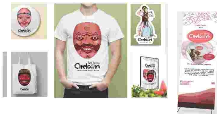
Gambar5 Media Pendukung

media pendukung dari perancangan ini dibuat berdasarkan permasalahan yang ada serta berdasarkan apa yang dibutuhkan target. Desain pada media pendukung disesuaikan dengan selera dari khalayak sasaran pembaca buku ini.