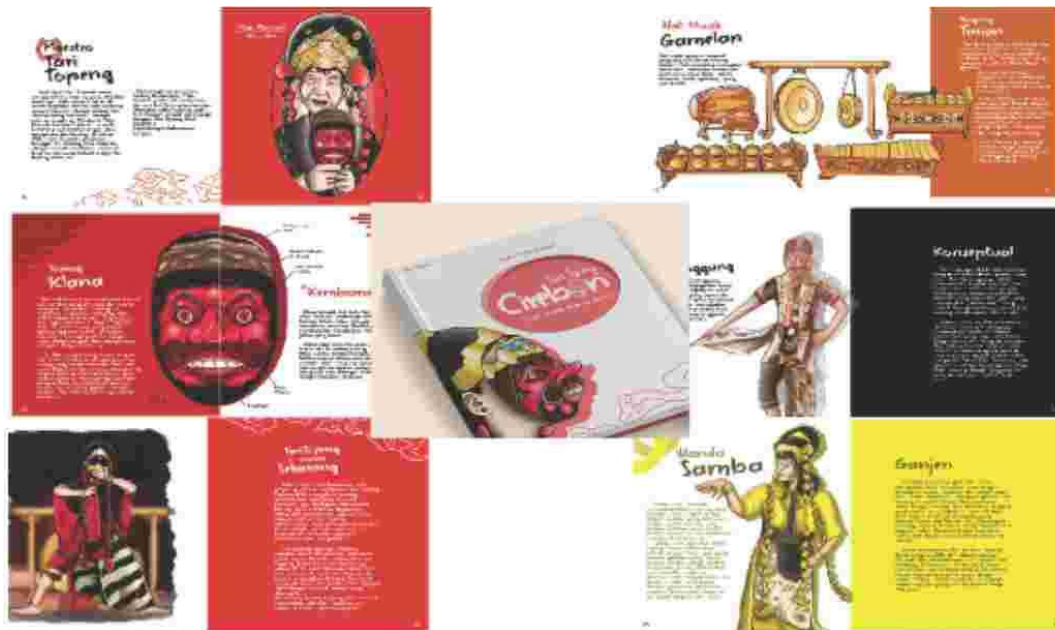
Gambar 6 Buku Hasil Perancangan

Media utama Berdasarkan hasil dari observasi dan penelitian yang dirasa paling tepat untuk penyebaran penyampaian informasi mengenai sejarah dan makna tari topeng Cirebon ini adalah Buku ilustrasi dengan pengayaan kartun dan penggunaan banyak warna agar menarik minat membaca Remaja di Cirebon. Dengan perancangan buku ilustrasi ini diharapkan membuat remaja khususnya dicirebon tertarik untuk kembali mengenal tari topeng Cirebon.