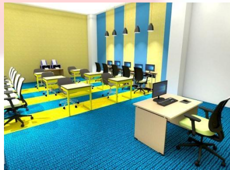
Gambar 9. Ruang Komputer

Ruang komputer menggunakan material dinding panel akustik untuk menghindari terjadinya gema ditambah dengan hiasan mural. Digunakan juga karpet untuk meredam suara. Menggunakan pencahayaan dan penghawaan buatan.