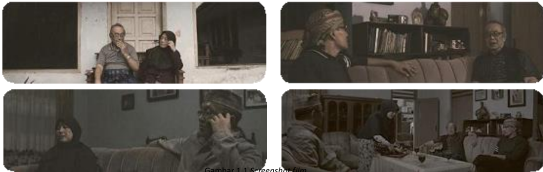
Gambar 1.1 Screenshot film