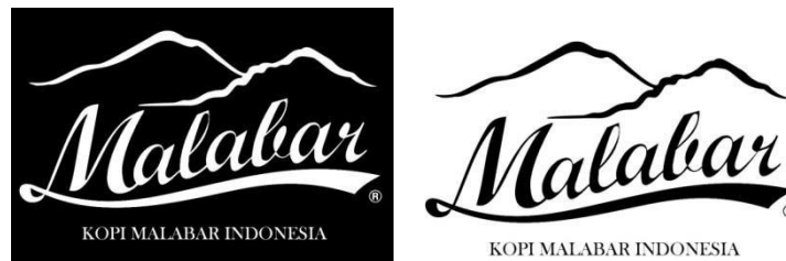
5.1 Penyederhanaan Logo Kopi Malabar Indonesia