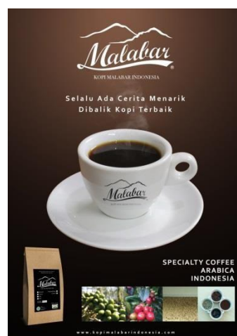
5.2 Poster Kopi Malabar Indonesia