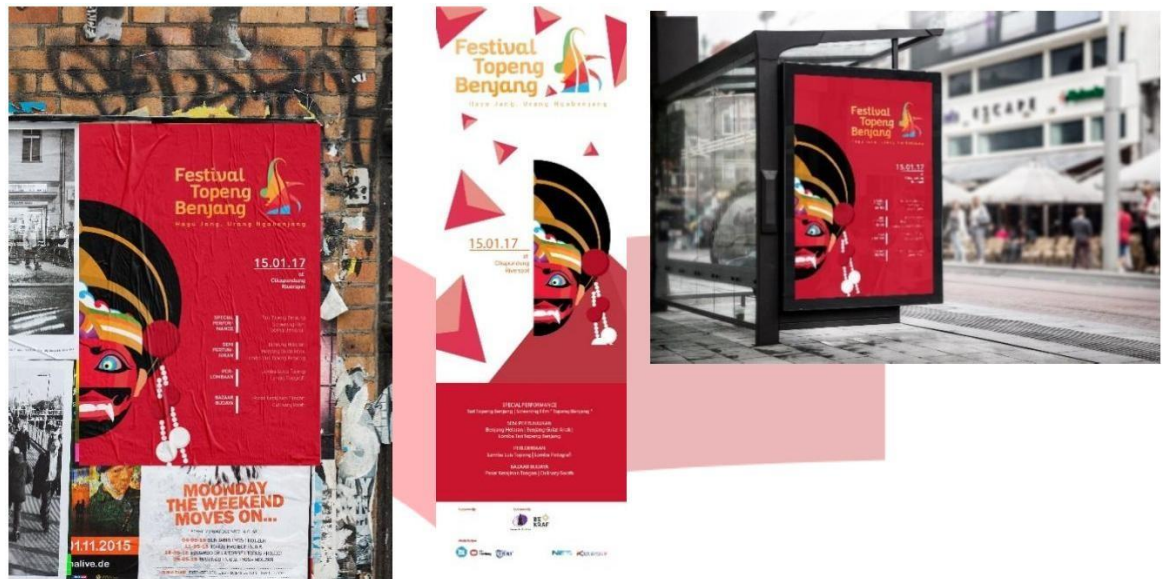
Gambar 8 Media Promosi