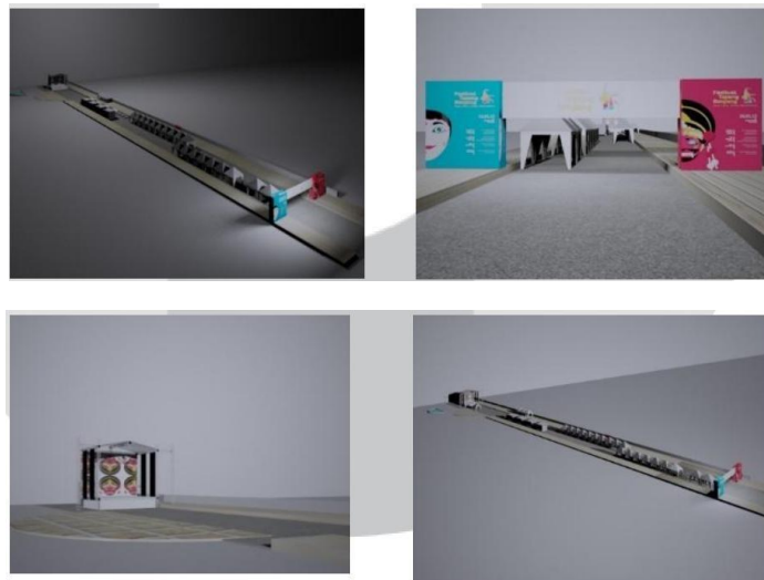
Gambar 6 Media Utama