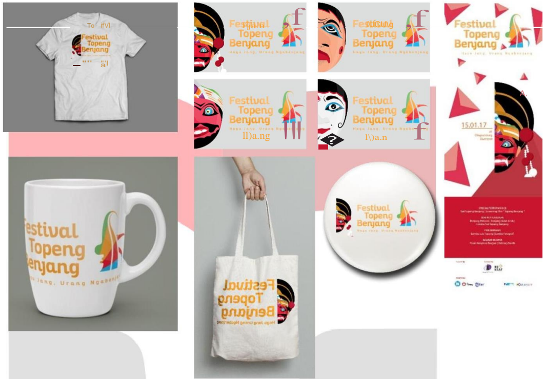
Gambar 5 Media pendukung