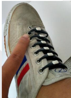
Gambar 1. Sepatu dengan Silicone Shoelaces