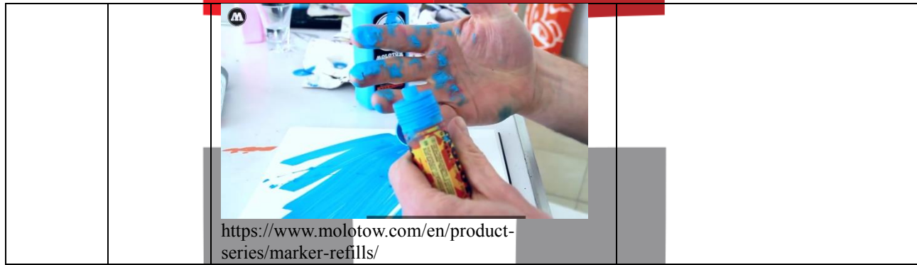
Tabel 2.2 Observasi Langsung dan dari Website Resmi Molotow (Sumber : https://www.molotow.com/en/product-series/marker-refills/ )

Dari hasil pengamatan dan wawancara menunjukkan bahwa kebocoran tersebut dapat dirasakan oleh pengguna yaitu dapat mengotori tangan dan merusak. Kebocoran tersebut diakibatkan karena salah satu fungsi yang tidak berjalan dengan baik dan kurang praktisnya dalam pengisian tinta sehingga mengakibatkan produk tersebut tidak mudah untuk digunakan.