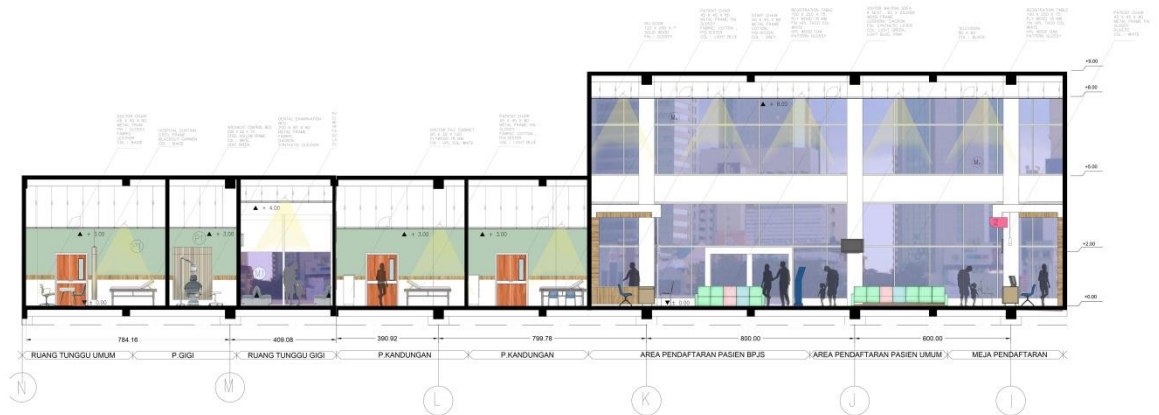
Gambar 2 Tampak B-B' Denah Khusus RSKIA Kota Bandung