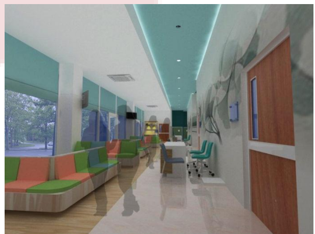
Gambar. 3 Area Tunggu Poli Kandungan