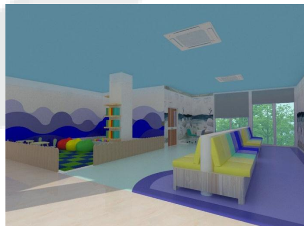
Gambar. 4 Area Tunggu Poli Anak