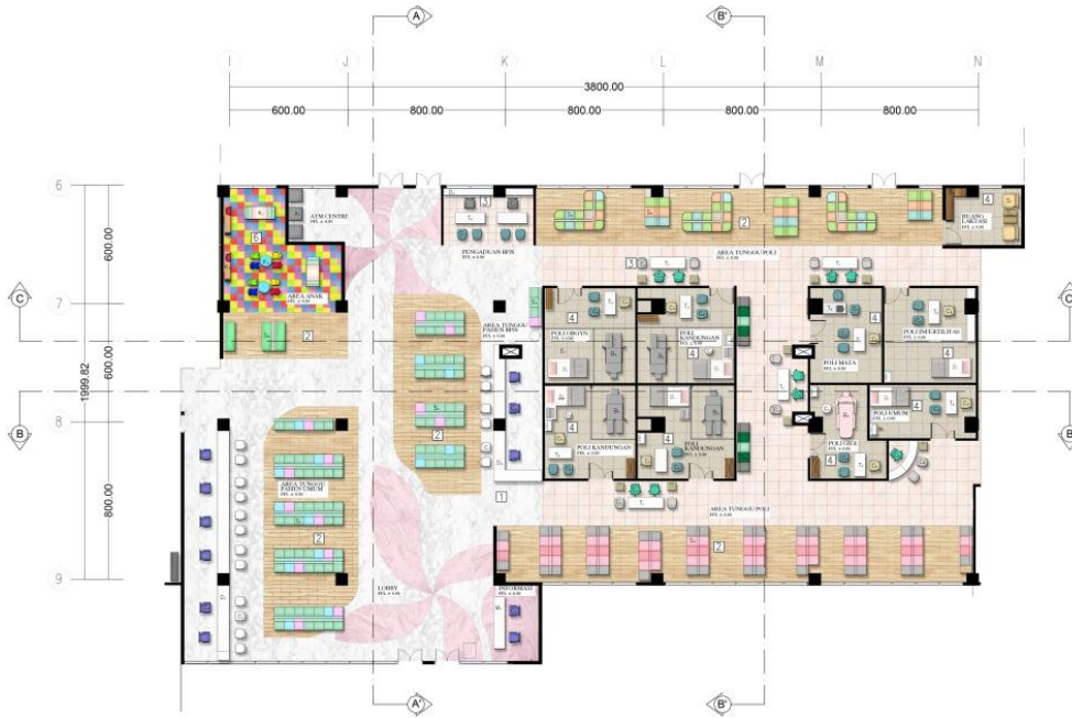
Gambar 1 Layout denah Khusus RSKIA Kota Bandung