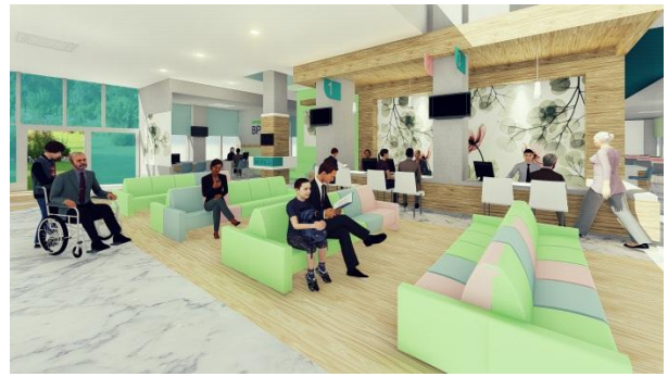
Gambar. 3 Area Pendaftaran