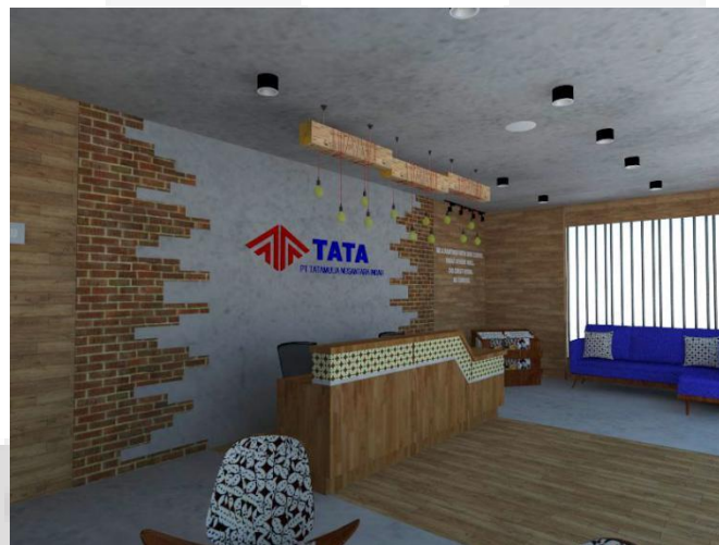
Gambar 2. Area Resepsionis