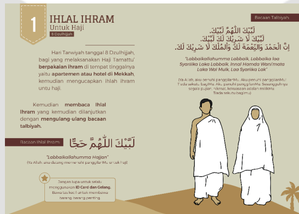
Gambar 1: Tampilan Karya

Mengambil judul “Panduan Menunaikan Ibadah Haji”, buku ini berisi pesan utama tentang panduan-panduan ibadah haji yang telah dikemas dengan baik sesuai dengan tuntunan haji yang sama seperti Rasulullah ﷺ lakukan. Sehingga media buku ini mampu memberikan materi panduan ibadah haji secara jelas dan mudah bagi calon jamaah haji serta mampu menjadi buku pembelajaran tentang pelaksanaan ibadah haji.