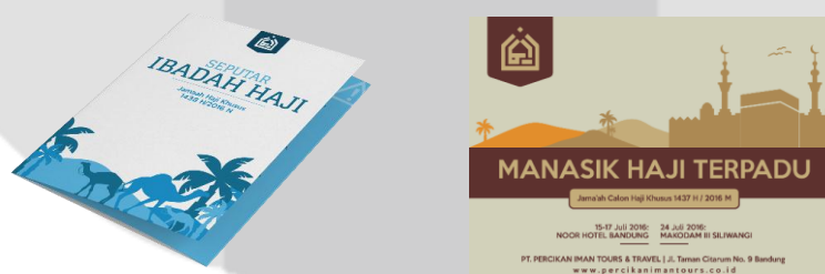
Gambar 2: Media Pendukung

Mengambil judul “Panduan Menunaikan Ibadah Haji”, buku ini berisi pesan utama tentang panduan-panduan ibadah haji yang telah dikemas dengan baik sesuai dengan tuntunan haji yang sama seperti Rasulullah ﷺ lakukan. Sehingga media buku ini mampu memberikan materi panduan ibadah haji secara jelas dan mudah bagi calon jamaah haji serta mampu menjadi buku pembelajaran tentang pelaksanaan ibadah haji.