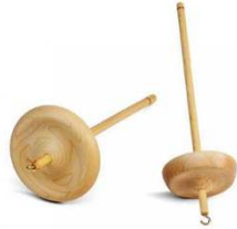
Gambar 2.1 Alat Pintal Drop Spindle

Drop spindle yang kadang juga disebut sebagai hand spindle adalah alat pintal yang hanya berupa sebuah batangan panjang tanpa roda pemutar yang biasanya terbuat dari kayu yang digunakan untuk memutar serat seperti wol, kapas, kapuk, rami agar menjadi benang.