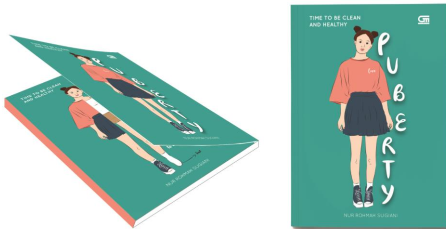
Gambar 2 Desain sampul buku

Pada sampul halaman depan buku terdapat dua gambar yang berbeda, tetapi dengan satu karakter yang sama. Hal ini dilakukan untuk menarik perhatian pembaca saat buku dipajang pada rak buku, karena buku memiliki desain cover yang berbeda dan memberikan experience tersendiri bagi pembaca yang akan melihatnya.