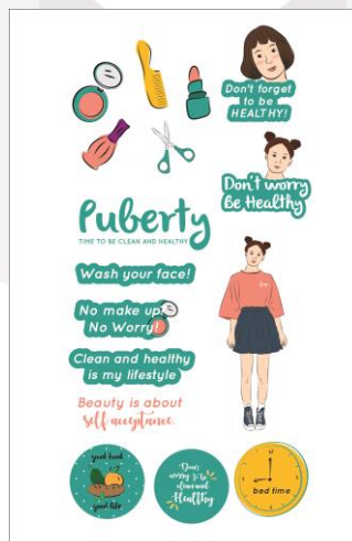
Gambar 4 Media tambahan