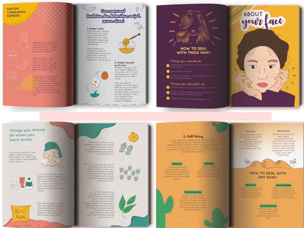
Gambar 3 Desain isi buku

Pada halaman isi buku terdapat beberapa bagian, yaitu halaman pendahuluan yang berisi halaman prancis, halaman hak cipta, halaman prakata, halaman daftar isi, dan halaman pendahuluan. Kemudian halaman teks isi yang berisi judul bab, penomeran bab, dan alinea teks. Serta halaman penyudah yang berisi daftar pustaka dan halaman catatan akhrit tentang penulis.