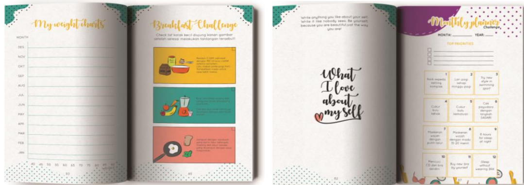
Gambar 5 Desain jurnal buku

Desain jurnal dibuat agar buku lebih edukatif karena melibatkan pembaca dalam pengisian jurnal tersebut. Jurnal buku ini dibuat untuk membuat pembaca lebih aktif dan teratur dalam menjaga kesehatan dan kebersihan tubuh.