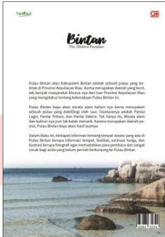
Gambar 2 Desain Cover Belakang Buku