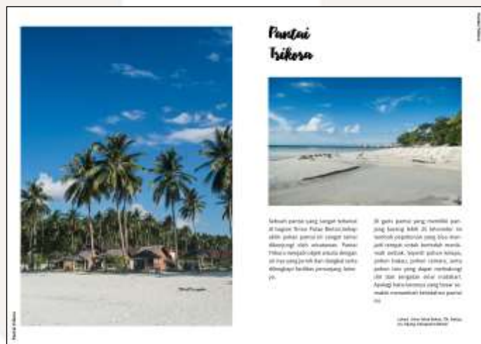
Gambar 3 Contoh Layout Halaman