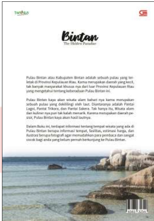
Gambar 2 Desain Cover Belakang Buku