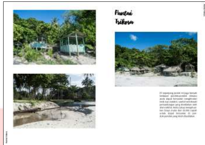
Gambar 4 Contoh Layout Halaman