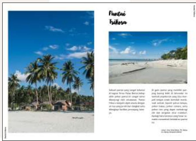
Gambar 3 Contoh Layout Halaman