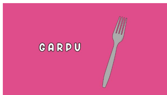
Gambar 3 Implementasi Font Pada Karya