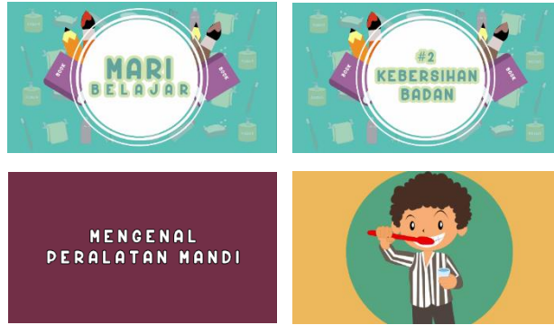
Gambar 6 Scene Motion Graphic