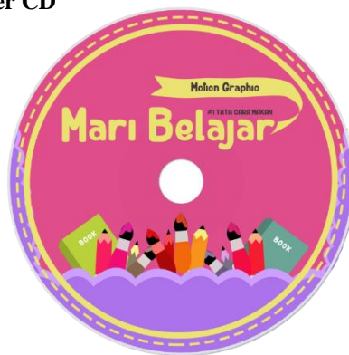
Gambar 7 Label CD