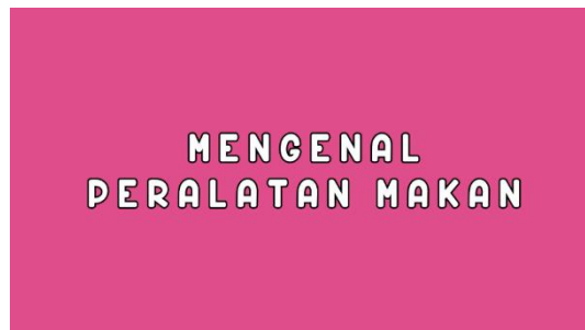
Gambar 2 Implementasi Font Pada Karya