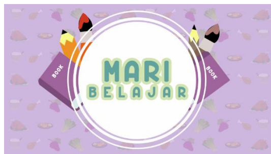
Gambar 1 Implementasi Font Pada Karya

Berikut ini merupakan pengaplikasian penggunaan tipografi yang telah dipilih pada konsep visual.