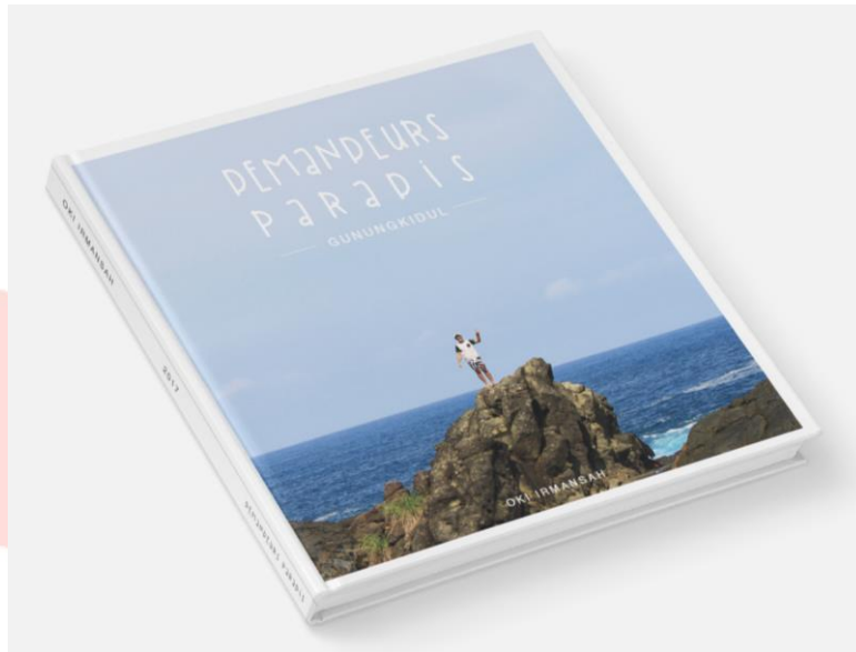
Gambar 2 Desain sampul buku

Pada sampul halaman depan buku menampilkan salah satu pantai di Gunungkidul yang didominasi oleh batu karang besar, hanya diberikan sedikit ulisan berwarna putih yang memberikan kontras lebih dan memusatkan fokus pada batu karang dan lautannya.