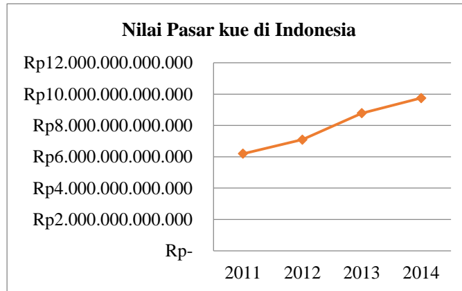
Gambar 1.1 Nilai Pasar Kue di Indonesia selama 2011-2014

Pada setiap tahunnya nilai pasar kue mengalami kenaikan dan menunjukkan adanya potensi peluang bisnis kue di Indonesia. Kota Tangerang merupakan salah satu kota di Indonesia yang memiliki potensi untuk mendirikan sebuah toko kue. Berikut grafik pertumbuhan nilai pasar kue di Indonesia :