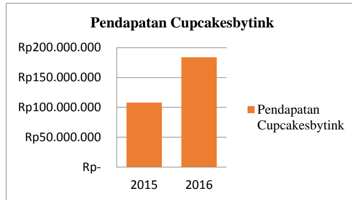
Gambar 1.3 Total pendapatan Cupcakesbytink tahun 2015-2016